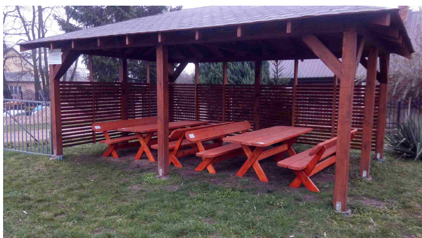
Doposażenie altany plenerowej w Mikulicach

Materiał informacyjny Urząd Miejski w Dobrej