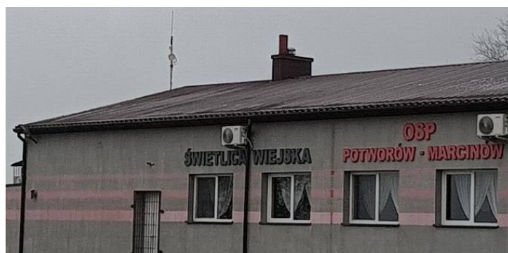
^Remont świetlicy wiejskiej w miejscowości Potworów