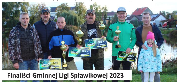
Finałiści Gminnej Ligi Spławikowej 2023