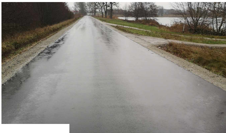
Mikulice - Stefanów

Materiał informacyjny Urząd Miejski w Dobrej