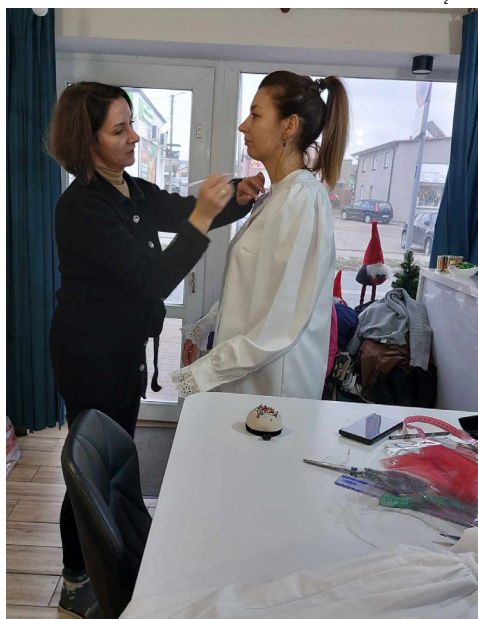
Promocja i kultywowanie tradycji w Miłkowicach – zakup tradycyjnych strojów ludowych