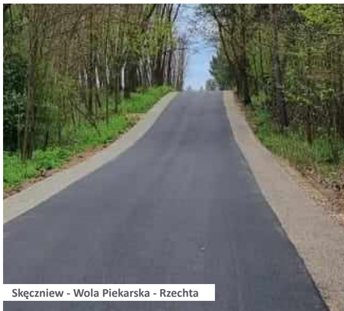
Skęczniew - Wola Piekarska - Rzechta