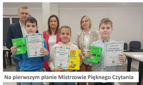
Na pierwszym planie Mistrzowie Pięknego Czytania