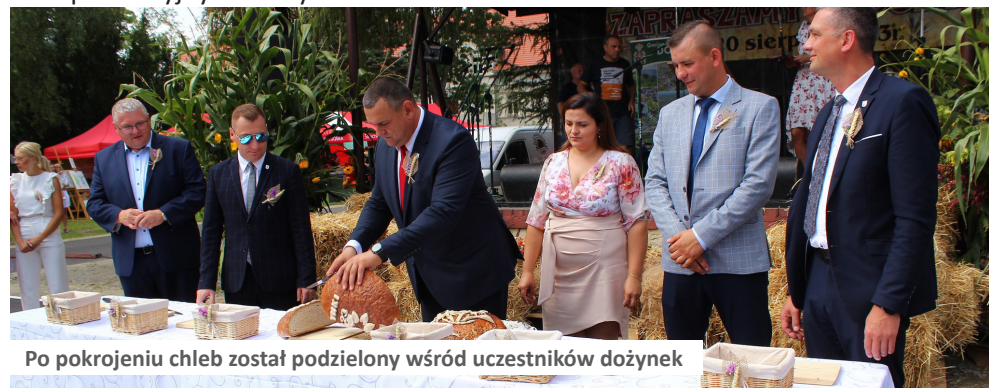
Po pokrojeniu chleb został podzielony wśród uczestników dożynek