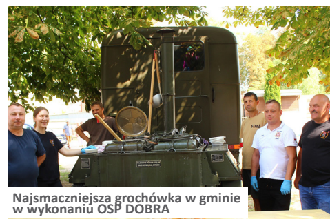
Najsmaczniejsza grochówka w gminie w wykonaniu OSP DOBRA