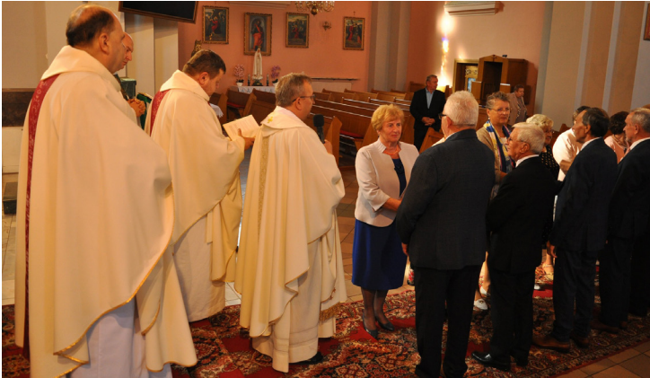
Uroczystości jubileuszowe rozpoczęły się mszą świętą w kościele pw. Narodzenia NMP w Dobrej

Samorząd Gminy Dobra po raz kolejny postanowił rozbudować uroczystości poświęcone parom ze stażem 50 lat pożycia małżeńskiego, które otrzymują przyznane przez Prezydenta RP Medale za Długoletnie Pożycie Małżeńskie, o pary ze sta-