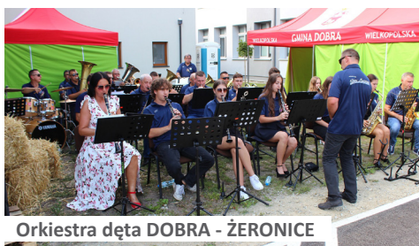
Orkiestra dęta DOBRA - ŻERONICE