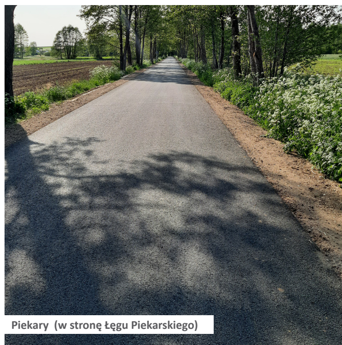
Piekary (w stronę Łęgu Piekarskiego)