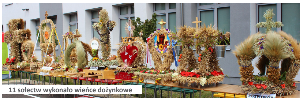
11 sołectw wykonało wianki dożynkowe