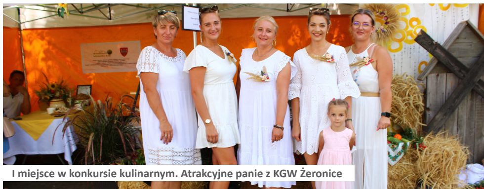
I miejsce w konkursie kulinarnym. Atrakcyjne panie z KGW Żeronice