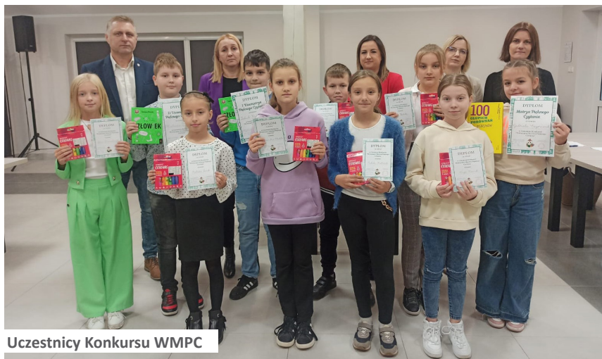
Uczestnicy Konkursu WMPC