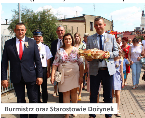
Burmistrz oraz Starostowie Dożynek

ków, Długa Wieś, Linne, Łęg Piekarski, Marcinów, Mikulice, Miłkowice, Moczydła Ostrówek, Potworów, Stefanów. Tym