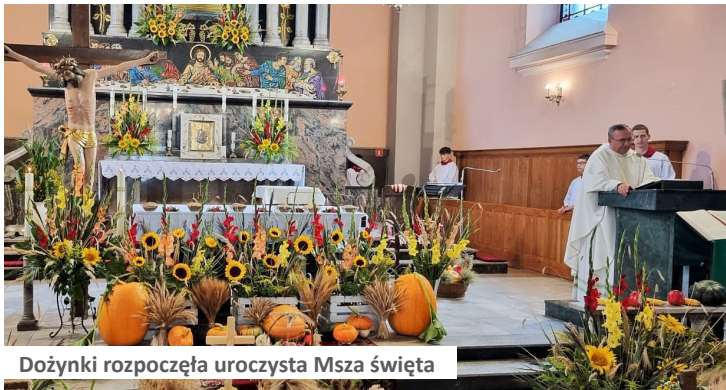
Dożynki rozpoczęła uroczysta Msza święta