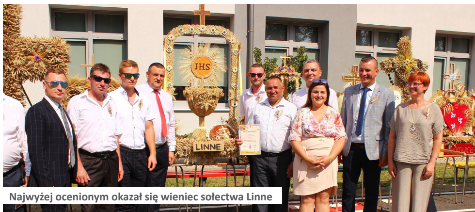
Najwyżej ocenionym okazał się wieniec sołectwa Linne

razem to delegacje wieńcowe oceniały swoje wianki. Za najpiękniejszy wieniec uznany został ten, wykonany przez mieszkańców sołectwa Linne, który będzie reprezentował gminę Dobra podczas Dożynek Powiatowych w Tuliszko- wie 3 września 2023r.